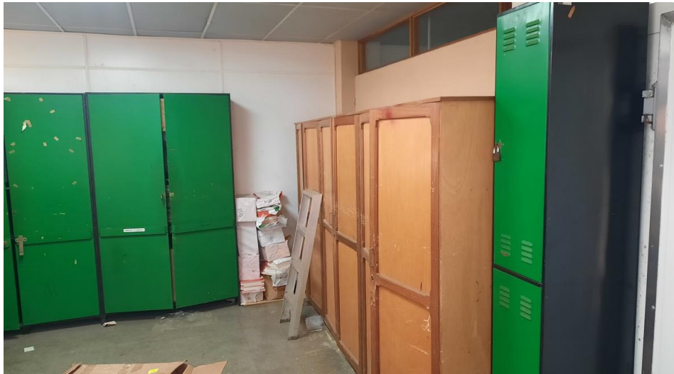
Foto No. 1 Anterior bodega de insumos de la administración del INISEFOR