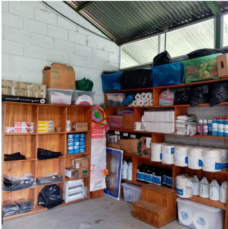
Foto No. 3 Nueva bodega de insumos de la administración del INISEFOR