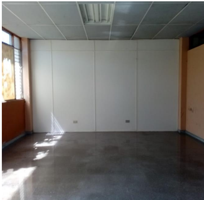
Foto No. 2 Nuevo espacio para la ampliación del Laboratorio de Análisis de Suelos y Foliare