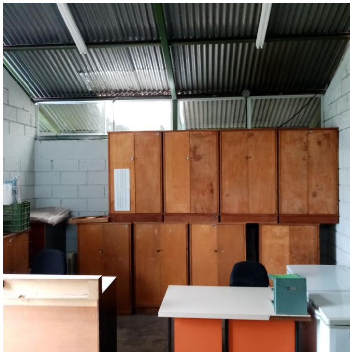
Foto No. 4 Nuevo espacio para la colección de referencia del INISEFOR